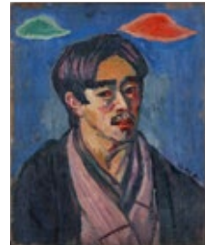
1. ERIC (血族)より 2016年 2.猪熊弦一郎《顔 ブルーの中》1992年 丸亀市猪熊弦一郎現代美術館蔵 ©公益財団法人ミモカ美術振興財団 3.岸田劉生 (画家の妻) 1915年 大原美術館蔵 4.横山裕一「PLAZA」140p 2019年 ©Yuichi Yokoyama, courtesy of 888books, ANOMALY 5.奈良美智 (Untitled (Broken Treasure)) 1995年 徳島県立近代美術館蔵 ©Yoshitomo Nara 6.笹岡由梨子《Planaria》2021年 助成: Arts Support Kansai 7.高山陽介《無題 (頭部 #72)》2020年 ©Yosuke Takayama, courtesy of ANOMALY 8.萬鉄五郎《雲のある自画像》1912年 大原美術館蔵 9. super-KIKI (Selfies) 2021年