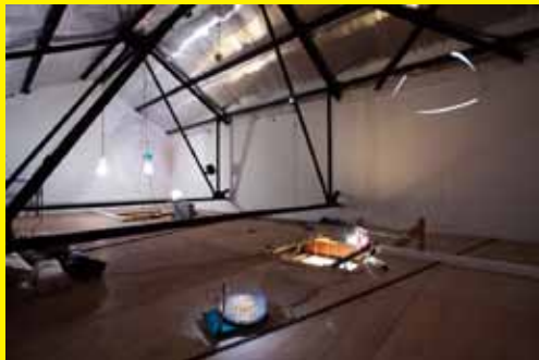
梅田哲也 オオタファインアーツ シンガポールでの展示風景 2013年