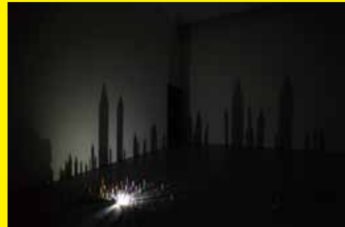
クワクボリョウタ 「10番目の感傷(点・線・面)」2010年 NTT インターコミュニケーション・センター [ICC] での展示風景