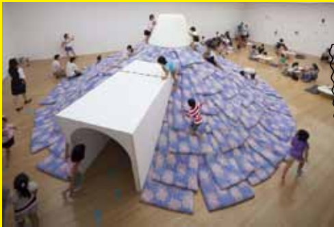
小沢剛 「あなたが誰かを好きのように、誰もが誰かを好き」2012年 豊田市美術館での展示風景

*Masao Yamaguchi, "Asobi no honrai no sugata" ("Play" in its true form) in Warai to Itsudatsu (Smiling and Lying) , Chikuma Shobo, 1984.