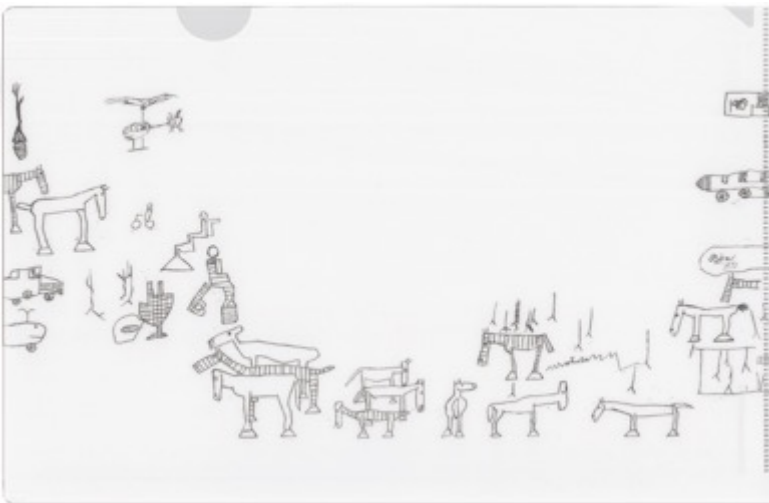
使用作品：猪熊弦一郎《創造の広場》 制作年：1991年