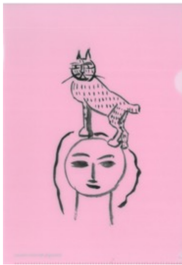
使用作品：猪熊弦一郎 題名不明 制作年：不明