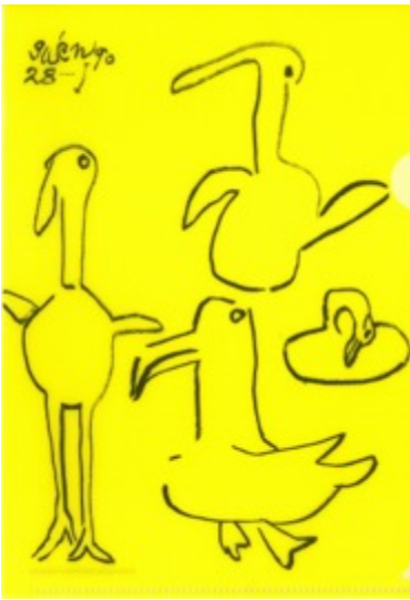
使用作品：猪熊弦一郎《鳥4》 制作年：1990年

価 格： A4サイズ用／各 330 円（税込） A5サイズ用／各 220 円（税込）