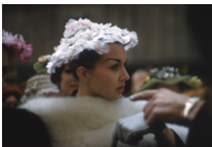
《セントパトリックデー》1959年 撮影：猪熊弦一郎