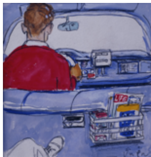
猪熊弦一郎《タクシー》 「小説新潮」表紙絵 1960年5月号