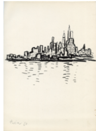
猪熊弦一郎《題名不明》1960年