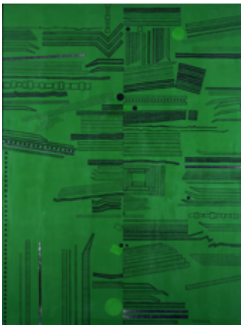
猪熊弦一郎《The City (Green No.4)》 1968年